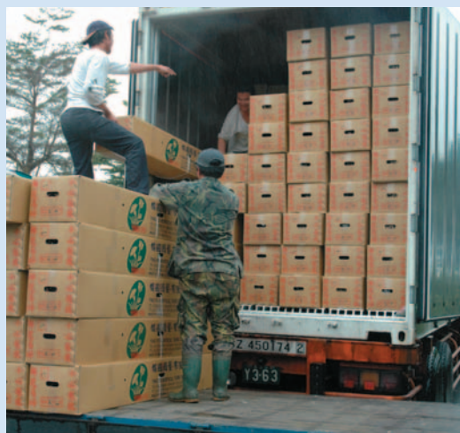
▲銀柳切枝產品裝櫃情形

銀柳在完成分級裝箱後，應移入冷藏庫進行降溫處理，以防止花苞芽鱗變褐並降低切枝的呼吸作用。目前外銷銀柳皆以冷藏貨櫃運輸至國外市場，建議冷藏貨櫃適溫為0~5℃，若溫度升高到10℃，花苞芽鱗容易發生劣變而影響品質。此外銀柳在裝櫃時，應注意堆疊方式，避免堆疊過多或過高而阻斷冷藏貨櫃的冷氣循環，造成貨櫃溫度不均，導致品質不一的情形。