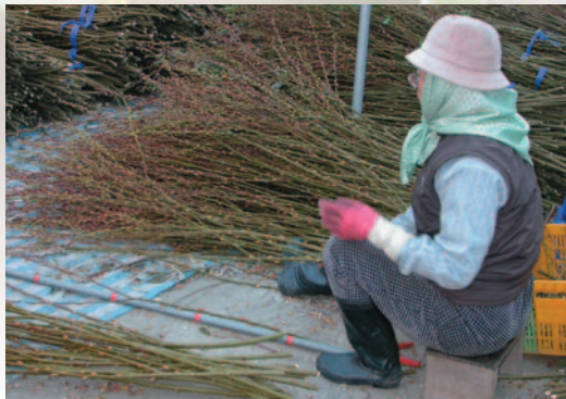
▲將品質不良枝條剔除後，依切枝長度及頂梢情形進行分級工作