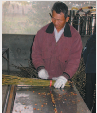
▲銀柳切枝綁成把的過程，花苞容易脫落