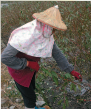
▲人工去葉可確保銀柳品質，但工資成本過高

新鮮採收的銀柳切枝，溫度在35℃、濕度100%下，約2~3天切枝品質會顯著降低；若濕度降至60%以下，約1天的時間枝條就會脫水乾枝，影響切枝品質甚大。因此田間採收時若能加入插水的步驟，並快速將銀柳切枝運回集貨場或陰涼的地方，即可避免熱害發生，維持良好的品質。田間插水以自來水為宜，不宜使用地下水或溝渠灌溉水，以避免雜菌感染或吸附重金屬，恐會影響切枝品質。若要省略田間插水步驟，建議採收後儘快將切枝運回集貨場，避免堆置並迅速進行分級包裝，包裝完成後立即冷藏。