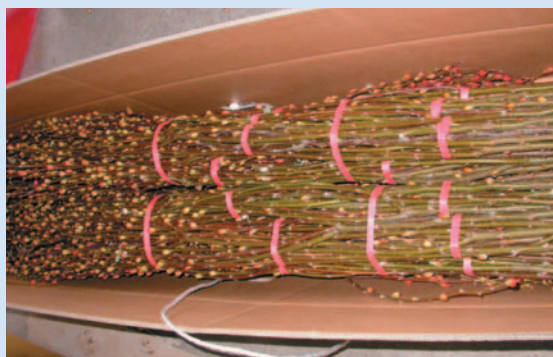
▲銀柳切枝包裝於適當紙箱中