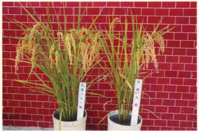
▲ 水稻花蓮21號(左)與台稉9號植株外觀之比較