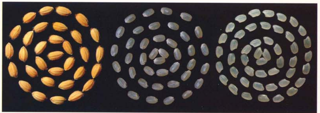
▲水稻花蓮21號稻穀(左)、糙米(中)與白米(右)外觀

水稻花蓮21號屬於豐產、優質的中晚熟梗型水稻。米粒大且食味優良，對水稻主要病蟲害如稻熱病及褐飛蝨等具有良好抗性。第一期作平均生育日數（由插秧至成熟）為129日，株高99公分，每叢穗數約18支，一穗粒數約86粒，稔實率為89%，千粒重26公克；第二期作平均生育日數為120日，株高97公分，每叢穗數約13支，一穗粒數約99粒，稔實率為76%，千粒重25公克（表1）。水稻花蓮21號成熟期稻穗穀粒飽滿，粒型整齊，稃尖（穀粒尖端）呈深紫色。