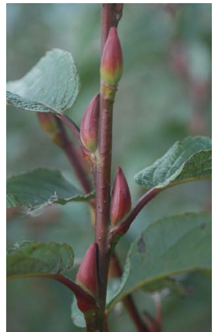
蘭陽2號及中國上海種花芽著生情形 左：蘭陽2號；右：中國上海種