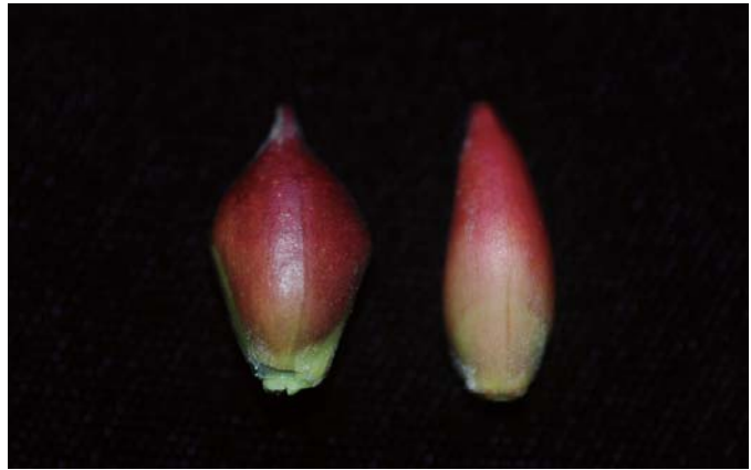
蘭陽2號及中國上海種切枝及花芽外觀 圖左為蘭陽2號；圖右為中國上海種