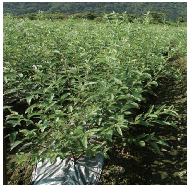
蘭陽2號生育中期田間生育情形