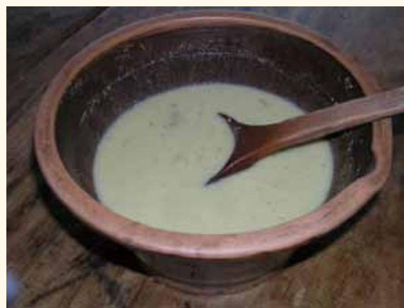
▲香噴噴的彭記擂茶

社區內有許多富有教育意義的建築文物，如「大和蔗工的厝」由原來的「大和戲院」改建，以蔗園記憶佈置空間，訴說蔗工過去的生活點滴，餐點則以當地特產—甘蔗入菜，手工豆腐也是村內有名的佳餚。富安宮位於大富村內，供奉古公三王，是社區的信仰中心；鍾家古厝為歷史悠久的房舍，為三合院式建築，已有60多年歷史。道地客家美食—擂茶，亦可讓遊客體驗DIY研磨樂趣。