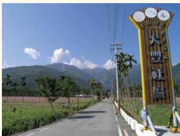
▲大豐社區入口指標