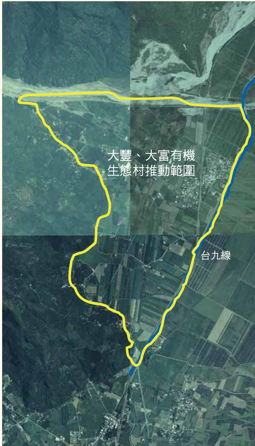
▲大豐大富有機生態村推動範圍