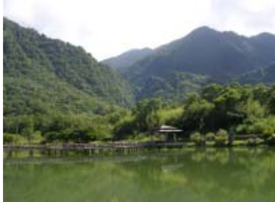
羅山村地質景觀－羅山大魚池

斷層池羅山大魚池。面積大約一公頃，很早以前是處沼澤地，沼澤中的水從地層裂隙上湧，湧水量越來越多，成為水量豐沛的沼澤地，約在 1935 年間，村民合力用人工把池底淤泥挑走，將沼澤地下方圍堵起來，從羅山瀑布開圳引水至大漁池蓄水，以供下方水田用水，後來附近村民合資養魚，彌補家計，當地居民稱它大埤塘（客語），也是現在的羅