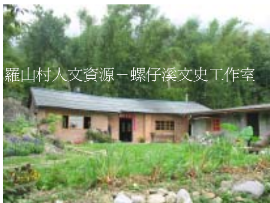
羅山村人文資源－螺仔溪文史工作室

料的方式，進行另一個社區閒置空間的修繕，並完成了螺仔溪生態驛站。值得一提的是，生態驛站是以小型生態園區的規劃設計及整建作為挑戰，在修繕過程中引入生態技術，實驗運用傳統砌石工法進行生態池、蘆葦床（去汙化糞池）的施作、廣植綠地增加透水鋪面，以及昆蟲棲地的營造等。並同步進行社區人文歷史、自然生態、產業資源等社區資料庫之建置。