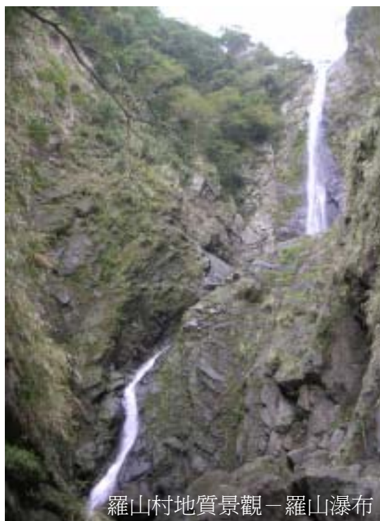
羅山村地質景觀－羅山瀑布

山大漁池。羅山大漁池有豐富的野鳥棲息，以秧雞最多，北國的雁鴨也是天然湖的嬌客。斷層池旁有步道、曲橋、涼亭可供遊客垂釣，每當夏、秋兩季菱角盛產成熟期，常可見村民或遊客浮艇於湖上採菱角的優美景象。在羅山大漁池尚可遠眺羅山有機水稻梯田，是花東縱谷中十分出色的景觀。