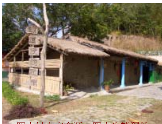
羅山村人文資源－羅山生態驛站

羅山村由於地理環境特殊及自然資源豐富，未來可整合地方資源，利用田園、自然景觀之優勢，再配合有教育、心靈、健康等充實的功能旅遊，並且結合地方產業特色發展田園料