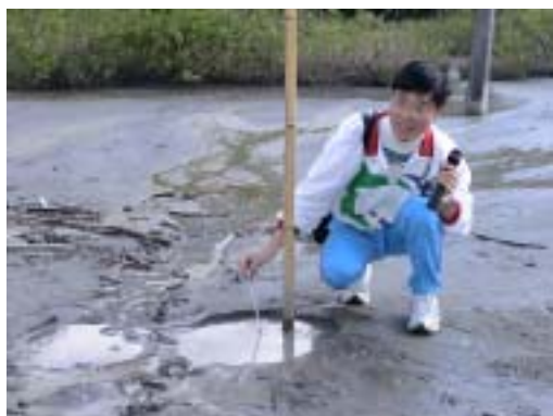
羅山村地質景觀－羅山泥火山

遙望，位於山巒之間的羅山瀑布正懸掛之間。羅山瀑布為羅山村主要的灌溉水源，也是羅山主要景點之一。羅山瀑布靠海岸山脈之西側、是螺仔溪的上游，地處海岸山脈斷層線附近，高達 120 公尺的飛瀑，分雙層傾洩而下，瀑布分兩層、上層落差約 100 公尺、下層約 20 公尺，水量頗豐、下瀉有如萬馬奔騰，氣勢萬千，瀑布下瀉後，匯成螺仔溪轉流向北，成秀姑巒溪的上源，瀑布下怪石嶙峋、在群山中有一道細長的白帶從天而降，極為壯觀。