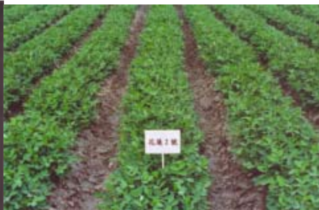
「花蓮二號」田間生育情形