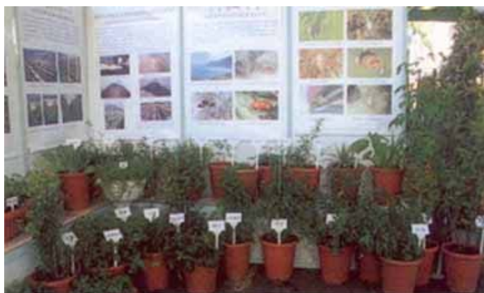
內容豐富的花蓮區農業研究成果展

休閒農業成果展示區部分，以製作精緻的壁報來說明花蓮宜蘭二縣的休閒農業發展現況，及提供多種圖文並茂的文宣來深度介紹各休閒農業園區或農場的景點及特色，幾乎被索取一空。會場上亦有本場工作同仁擔任解說，並在於二天內舉辦八場次的文旦精油 DIY 教學活動，現場指導民眾利用文旦精油自製「精油香皂」及「精油乾洗手劑」，場場客滿，獲得不錯的迴響。