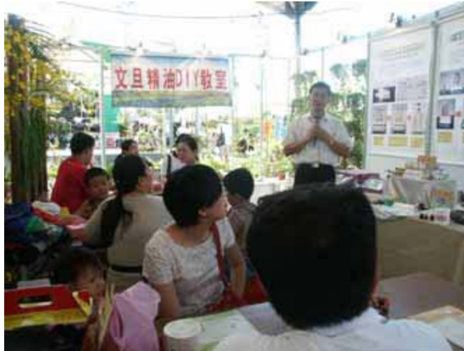
場場滿座的文旦精油 DIY 教室