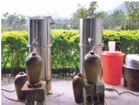
蒸餾，溫度控制在 85~92 之間。