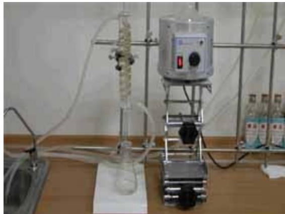
蒸餾酒醪待測酒精