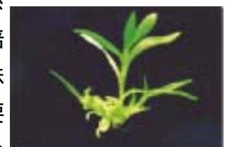
轉殖螢火蟲螢光酵素基因之百合水仙組織培苗

進行基因轉殖之前，首先必須要建立一套有效率的植物「再生系統」，什麼是「再生系統」呢？其實就是一種植物繁殖系統，例如培養根、莖、葉、花、胚莖.....等等植物器官，從其表面再生出新植株的技術。只是基因轉殖技術，是透過單細胞分子層次在進行，所以要建立再生系統，就要從單一細胞開始，也就是說從單一細胞，可以分化成整個植株的程序，這個程序要先建立起來。再生系統之建立，通常都是以組織培養的方式來達成，所以組織培養，是基因轉殖的一個關鍵技術。