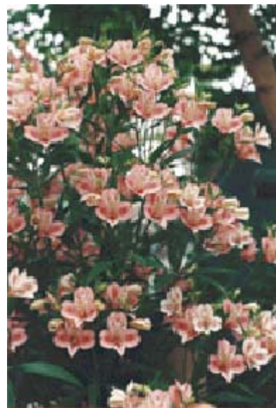
經過改良後的百合水仙栽培品種

百合水仙是阿爾氏科 (Alstroemeriaceae) 的多年生、單子葉花卉植物，英文名字稱為「Alstroemeria」，在台灣市面上很少看得到，只有在霧社高冷地有農家栽培，種植面積約僅二公頃而已。「百合水仙」在國內被人叫久了之後，又變成「水仙百合」，其實它既不是百合，也不是水仙，花形花色看來倒有點像杜鵑花，枝條跟葉子看來有點像百合。其實它也沒有英文名字，Alstroemeria 是它的屬名，也就是學名的前半段，大家都這麼將就的叫它。這個奇特的花，中英文名字都很怪異，為什麼會這樣呢？原來它是原產在南美洲的植物，北半球原本沒有，瑞典植物學家林奈氏最早是從他南美洲來的學生 Claudius Alstroemer 獲得這種植物，所以就以他的姓氏來命名。