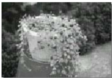
普拉特草經由本場開發成園藝盆栽，果實深紫紅色誘人，具園藝觀賞價值

普拉特草分佈於本省 500-3,000 公尺山區陰濕地，中國大陸華南地區、喜馬拉雅山東部至中南半島、馬來西亞、印度等均有原生。它為多年生草本，莖細長，匍匐，節處生根，葉互生，長寬各在 1-2 公分。花小，淡紫色，單生於葉腋間，在秋天到翌年春天為開花及結果期，花開 1-2 天，開後約 10 天可見綠色小果，二星期後果實由綠轉紅紫色，為橢圓形漿果，果長 1-1.5 公分，內藏多而細小種子。由於果實顏色漂亮，具觀賞價值，適合開發為園藝產品。