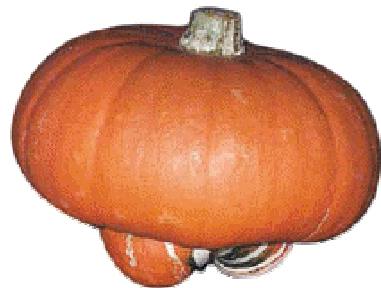
造型非常特殊的南瓜品種 - 福瓜