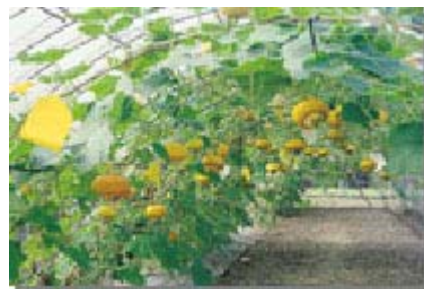
使用黃色黏紙防治蚜蟲及瓜蠅危害