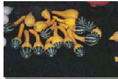
造型可愛的觀賞南瓜品種 - 龍鳳南瓜

觀賞南瓜可採露地栽培或棚架栽培二種，行露地栽培時其行距為 2 公尺株距 1 公尺，棚架式栽培可利用以鋼條為材料之棚架，直接將鋼筋兩端插入地上形成拱型之棚架，鋼條距離為 60 公分，棚架完成後再覆以塑膠尼龍網，以利南瓜蔓攀爬之用，株距則為 80 公分。而為了減少病蟲害發生及提昇觀賞品質宜採設施栽培，可利用以鍍鋅鐵管為骨架，上覆 PE 或 PVC 塑膠布搭建成之隧道式防雨棚，每棟高 2.5 3.6 公尺，寬 5 6.6 公尺，長 20 30 公尺，採單棟或連棟之型式