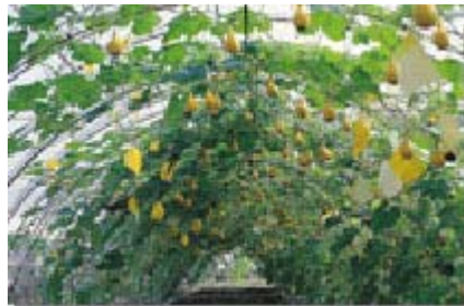
以棚架方式栽培觀賞南瓜結果量多而且果形優美