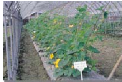
觀賞南瓜生育初期需要引蔓上棚架