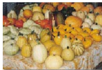
形形色色的觀賞用南瓜