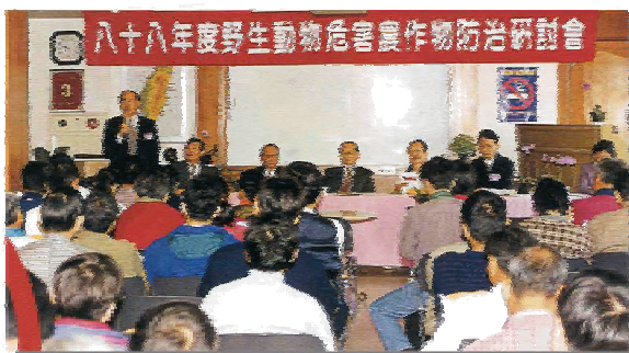
本場侯場長福分致詞

此次活動匯集各界研究野生動物之專家學者、農業行政、生產人員，共同為野生動物管理，進行整合性研討並實地觀摩花蓮地區水稻、甜椒、番茄作物受害發生情形，農友採取與本場推荐防制措施，期望在落實研究之實際效益時，也能兼顧野鳥保育與農業經營等功能。