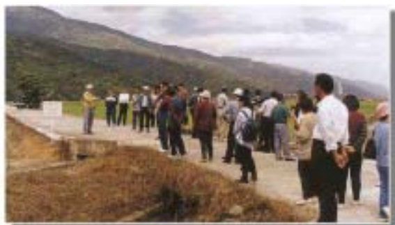
本場研究人員於觀摩現場解說