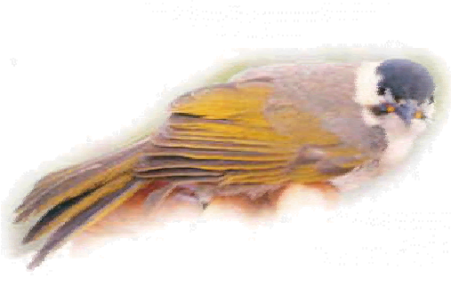
花蓮地區破壞農作物的野鳥烏頭翁