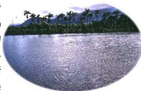
種植前田區先行浸水， 可防治地下害蟲

自從人類從事集約式栽培蔬菜以來，即不斷面臨害蟲威脅，當時並沒有所謂的「農藥」可以使用，防治害蟲皆是以最原始的方法，例如以徒手捉害蟲、忌避植物葉片搗碎加水噴施於蔬菜葉片等方法，直到 20 世紀初「農藥」的發明，改變了人們對於害蟲防治的習慣與方法，由於其具有經濟、方便、有效等特性，使得人類大量使用農藥，漸漸的隨著使用量大增，農藥所帶來的後果亦一一顯現。農藥殘留於自然界之土壤、水、空氣中，隨著食物鏈使影響層面加大，甚至影響到人類本身的健康。如今人們已經漸漸朝向減少使用農藥或不使用農藥之有機栽培法從事耕作，以確保使用者及消費者之安全。目前蔬菜害蟲種類繁多，以下介紹蔬菜主要害蟲種類之危害特性及其防治要點，期能對農民有所助益。茲將蔬菜重要害蟲之危害習性及其防治要點敘述如下：