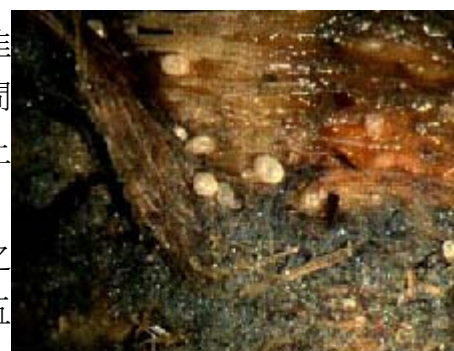
根蟎主要危害蔬菜地基部之根部及莖部

蔬菜上主要有番茄班潛蠅，非洲菊班潛蠅、蔥潛蠅、韭潛蠅，本類害蟲主要以類似蛆狀之幼蟲潛食於上、下表皮間之葉肉，造成彎曲之白色食痕，嚴重者葉肉被啃食完剩下上下表皮，使被害植株生長緩慢。於葉片上或掉落土中化蛹，成蟲善飛行，因此防治上主要在於降低成蟲密度，較有效之方法為以黃色黏紙誘殺，田區之設置密度，以兩黏紙距離五公尺內且高度低於1公尺之防治效果較好。