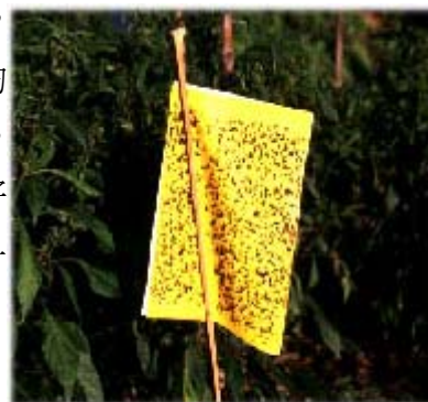
田間懸掛黏板可誘集粉蝨、薊馬、潛蠅等害蟲

危害蔬菜最重要者有南黃薊馬、台灣花薊馬等，其中南黃薊馬寄主範圍較廣，包括有瓜類之冬瓜、苦瓜、洋香瓜、另外豆類、茄子、青椒等皆可被危害，通常以瓜類受害較嚴重，台灣花薊馬可危害豌豆。薊馬年發生約二十代，通常棲息於新芽處成蟲、若蟲皆以銼式吸式口器危害，使心葉皺縮，無法伸展。薊馬成蟲具有飛翔能力且對藍色有偏好性，因此可以藍色黏紙誘殺成蟲，於田區每隔五公尺內設置一張，高度低於一公尺，可誘殺大量薊馬成蟲。