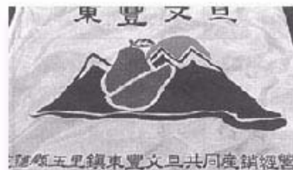
令人精神昂揚，頗富特色的班旗，出自曾班長的巧思