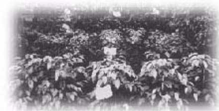
榕樹品種很多，極適合作為室內觀賞盆栽植物

「廣東榕」等。還有室內盆栽常採用，葉片呈現波浪狀，枝條下垂，外觀極為輕盈美妙的「垂榕」、「斑葉垂榕」等。此外在野地裡隨處可見的有稜果榕、牛奶榕、澀葉榕、白肉榕等等。