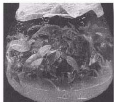
斑葉垂榕芽條繼代培養後發根成爲完整植株，可出瓶定植

本場最近開發成功另一種繁殖法，稱為組織培養法，其做法是取榕樹的莖頂約 1 公分長，經過酒精及漂白水充分消毒後，接在無菌培養基上面培養，培養基的成份為 MS(1962) 鹽類配方，再加蔗糖（20g/l）及苯甲基腺嘌呤（BA,1ppm），經過 2-4 個月後這些莖頂即萌發出許多芽體，成為叢生狀。把多芽體分切開來轉換到新的培養基，結果會再產生許多芽體，如此不斷的換培養基作繼代培養，芽體即不斷的增加，繁殖速率極為可觀，例如垂榕每 3 週繼代培養一次，其增殖倍數為 4.2 倍，斑葉垂榕每 2 週繼代培養一次，其增殖倍數