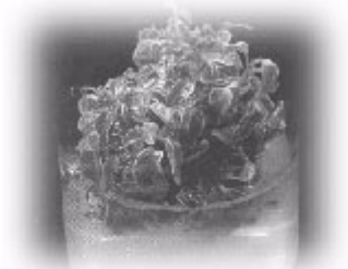
斑葉垂榕莖頂組織培養後產生大量叢生芽條

條剪成一段一段，每一段含有二片葉子，枝條基部兩側的樹皮削去約一公分長，成楔形，然後浸漬在引朵丁酸（IBA）500 倍的水溶液中 5 秒鐘，陰乾後再扦插，扦插用的介質以 2 號蛭石混合真珠石（1：1）的效果最佳。扦插後將插穗放在裝有定時噴霧裝置的苗床上，經過二個星期後，基部切傷的部位開始長癒合組織，三個星期後發根，四星期後可以取出來定植，夏季的繁殖速度比冬季要快。