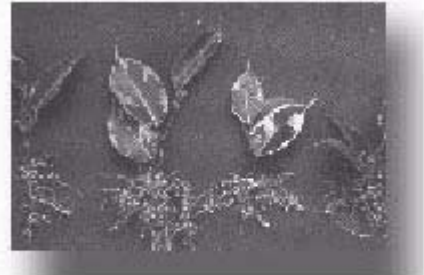
榕樹節段扦插繁殖法，莖基部以IBA處理後扦插發根的情形

榕樹的種類很多，在本省到處都可以見到，像最常種在公路旁邊當作行道樹，有的品種會長鬚鬚（氣根），有的品種不會的「正榕」；種在安全島上，適合做綠籬，葉片呈亮麗黃色的「黃心榕」；種在庭院，葉片呈現乳白色與綠色鑲嵌狀的「乳斑榕」；葉片厚且圓的「厚葉榕」；葉片很大而外表看起來像小提琴的「琴葉榕」；一年掉二次葉子，株形蒼勁，鳥兒喜歡吃它果實的「鳥榕」；喜愛盆景人士栽培的「蘭嶼榕」、「綠島榕」、「金門榕」、