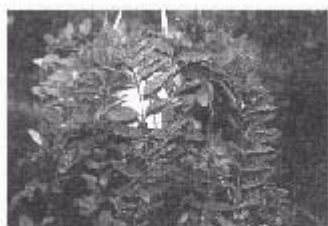
短毛萼口紅花開花情形

觀葉植物大部份原產於熱帶或亞熱帶山區，分別具有各種不同的性質，喜好溫暖、潮濕而有明亮間接光線的生長環境。夏季高溫生長較快，冬天耐寒性差生長慢，栽培之前最好能先了解其耐日照及耐寒等生長特性。吊盆植物多為蔓藤性，因其草姿、葉形、葉色、花紋等奇特而為人喜愛，供人懸吊觀賞。其莖節處容易發根，一般多用扦插繁殖，此處僅就宜蘭地區栽培較多的幾種吊盆觀葉植物，簡介如下：