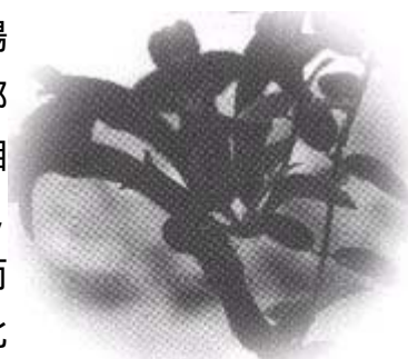
毛萼口紅花花朵著生在枝梢頂端

宜蘭地區北方和西側是雪山山脈，南邊是中央山脈，由蘭陽溪沖積成似三角形的蘭陽平原。全縣面積 2,134 平方公里，大部份為山地及山坡地，平地僅占 18%。82 年年平均溫度 20.5℃，相對濕度 82.4%，全年降雨量 2,233mm，全年日照時數 1,427 小時，平均每天僅 3.9 小時。冬季受東北季風影響，氣候冷涼、潮濕而多陰。對於一般花卉生長不利，但能適合觀葉植物生長。87 年北宜高速公路即將開通，日後由宜蘭往台北的交通將更為便捷，往返時間縮短很多，種種外在因素對於宜蘭發展觀葉植物的前景相當有利。