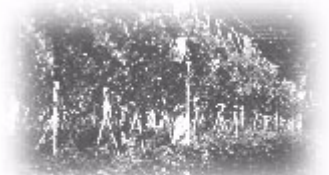
溫室內黃金葛栽培情形

4.鯨魚花：苦苣苔科多年生草本蔓藤植物，原產中、南美洲及西印度群島，是所有冬季吊盆植物中最富色彩變化的植物之一。單葉多對生，同一節處著生二片葉，大小及形狀常會有顯著不同，在冬季及早春期間常開狀似鯨魚的美麗管狀花，色澤鮮艷，很有觀賞價值。耐陰性強，適合在冬季溫度10℃以上之地區栽培。