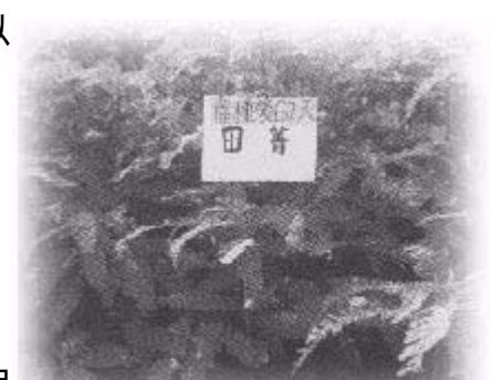
春作田菁最適當掩施期的生育情形（播種後60天左右）

田菁在本省栽培通常可生長良好，除特別貧瘠之土壤施用少量氮、磷、鉀肥外，可不施任何肥料。田菁性喜潮濕，土壤過於乾旱時應適量灌溉，但中、南部七、八月間雨量充沛，仍