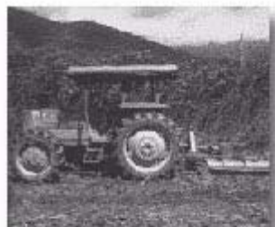
利用「離心式切割器」將田菁切碎作為綠肥

田菁掩施時期，生長至 1.2 公尺左右時，莖葉柔嫩多汁尚未木質化前翻耕為宜，過早有機質生產量不高失去綠肥栽培意義，過晚植株高大不掩埋，且木質化不易腐熟影響後作。一般適合掩埋時間，春作播種後約 60 80 天，夏作及夏季休閒期播種後約 40