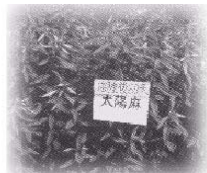
一般綠肥可利用耕耘機直接翻耕

太陽麻播種後 3??天即發芽，苗期切忌乾旱，為使幼苗生長順利，應隨時注意土壤水份，酌予灌溉。由於採較密植之栽培方式消耗肥份多，故應酌施化學肥料，生育中期後，枝葉漸漸增多，生長繁茂且根部固氮量增加，則不必再施肥。撒播及條播之密植栽培初期管理良好時，生長迅速，雜草較不易滋生，可不必全面除草，僅有高大雜草以人工拔除即可。惟播種前若田間雜草甚多時，則宜先噴施克蕪蹤等殺草劑後，再行播種為佳。太陽麻生長初期較常發生蟲害有小綠葉蟬及蚜蟲，無正式推廣的防治方法，但可參考下列方法處理。